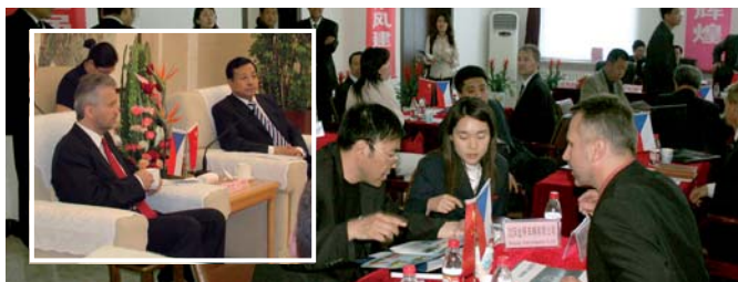
Jednání podnikatelů v Číně

Společnost JVM-RPIC, spol. s r.o. pravidelně připravuje zahraniční podnikatelské mise do celého světa. Jedná se o dílčí projekty posilující internacionalizaci ekonomiky ve Zlínském kraji. Z tohoto důvodu jsou na cestách podnikatelé podporováni i politickou reprezentací ZK, což především ve výchozích teritoriích hraje významnou roli.