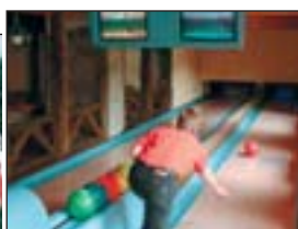
Vybudování bowlingové dráhy v Park hotelu Všemina (využití programu Malý Kredit)