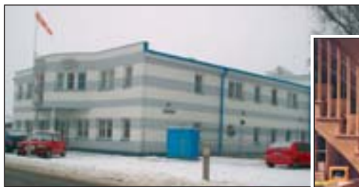
Firma ALTECH spol. s r. o. v Uherském Hradišti využívá program IMPULS pro vývoj nových generací šikmých schodišťových i svislých přepravních plošin pro invalidní občany

Firmy, které se k integračnímu auditu rozhodnou, na něj mohou získat až padesátiprocentní dotaci z ministerstva průmyslu a obchodu.