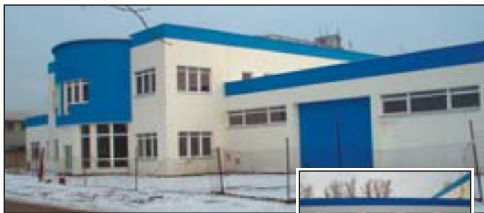
Dobudování provozní budovy firmy DELTA Trans spol. s r. o. v Uherském Brodě (využití programu Malý Kredit)