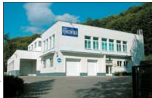
Společnost Lécivé vody a. s. využije program Phare 2003 na instalaci nových technologií v provozovně v Luhačovicích